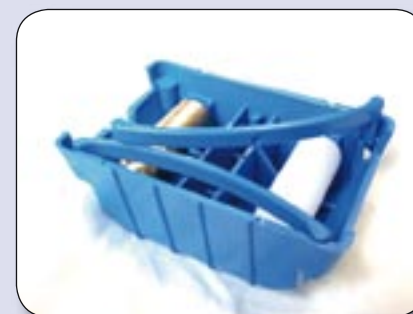
Bild 3: Rechter und Linker Federbügel mit Führung zur Sicherung gegen herausfallen.