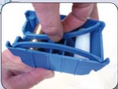
Bild 1: Zum Rollenwechsel Federbügel einzeln nach innen drehen. Für V-Cup, X-Cup und Strukturriller.