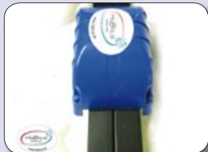
Bild 5: Ski fest in einen Wachsbock spannen z.B. Art.Nr. 0023 oder 0024 und mit dem Strukturgerät in Pfeilrichtung von der Skispitze aus, mit Druck auf das Gerät in Richtung Skiende strukturieren.