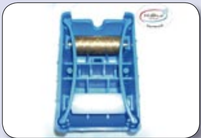
Bild 4: Jeweilige Strukturrolle wie im Bild einsetzen und beide Federbügel wieder einsetzen.