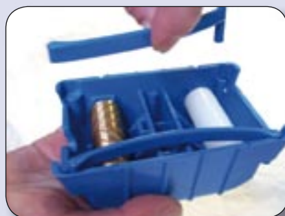
Bild 2: Federbügel nach oben herausnehmen.