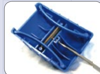
Bild 6: Zum Wechseln der Einsätze beim Strukturriller, Federbügel herausnehmen, Schraube lösen und den Einsatz auswechseln. Schraube wieder festdrehen (nicht mit Gewalt).