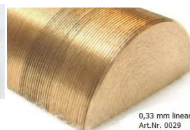
0,33 mm linear Art.Nr. 0029