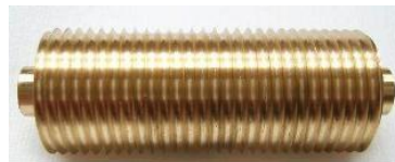
Crossstruktur rechts 1,75 mm Art.Nr. 0008