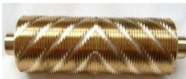
Doppel V-Struktur 0,8 mm