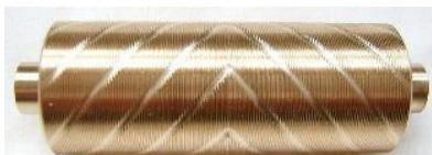
Doppel V-Struktur 0,30 mm