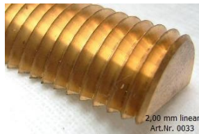
2,00 mm linear Art.Nr. 0033