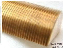
0,75 mm linear Art.Nr. 0031