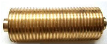
Crossstruktur links 1,75 mm Art.Nr. 0007