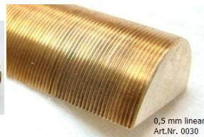
0,5 mm linear Art.Nr. 0030