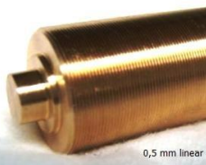
0,5 mm linear