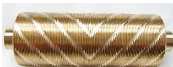
Doppel V-Struktur 0,5 mm