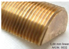
1,00 mm linear Art.Nr. 0032