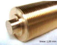
linear 1,00 mm